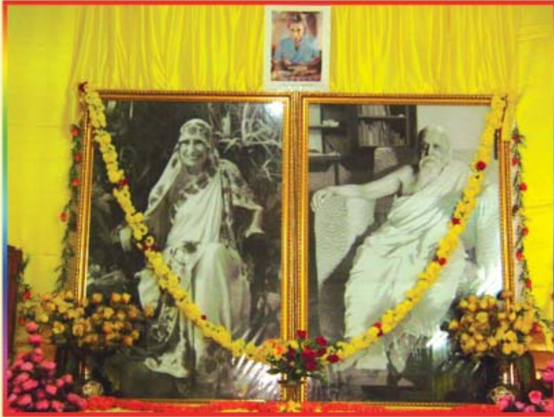
Meditation Hall of Sri Matriniketan Ashram